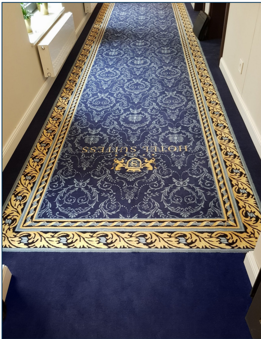
Hotel Suitess, Dresden

Art 1400 ist die höchste, dichteste, widerstandsfähigste und somit luxuriöseste Qualität der Reihe mit dem ruhigen, feinkörnigen Warenbild. Der kleine Materialzuwachs steigert die Trittschallmindernde und wärmedämmende Wirkung noch um einige Prozentpunkte und hilft so, Energie zu sparen. Die Verlegung über einer Fußbodenheizung wird jedoch wegen des hohen Wärmedurchlasswiderstandes nicht mehr empfohlen.