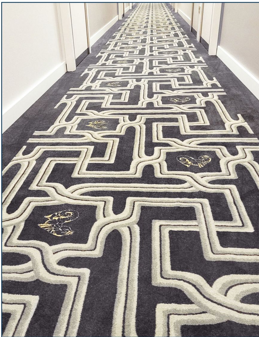
Hotel Stadtpalais, Köln

AP 1250 ist eine äußerst dichte und widerstandsfähige Ware mit exzellenter Trittelastizität, die höchsten Komfortansprüchen genügt. Kombiniert mit einem 550g- oder 1000g-Vliesrücken kann eine hervorragende akustische und wärmedämmende Wirkung erzielt werden. Dies macht AP 1250 besonders geeignet für Zimmer und Flure der gehobenen Hotellerie. Für die Verlegung über einer Fußbodenheizung empfehlen wir einen Gewebe- oder AV-Rücken.